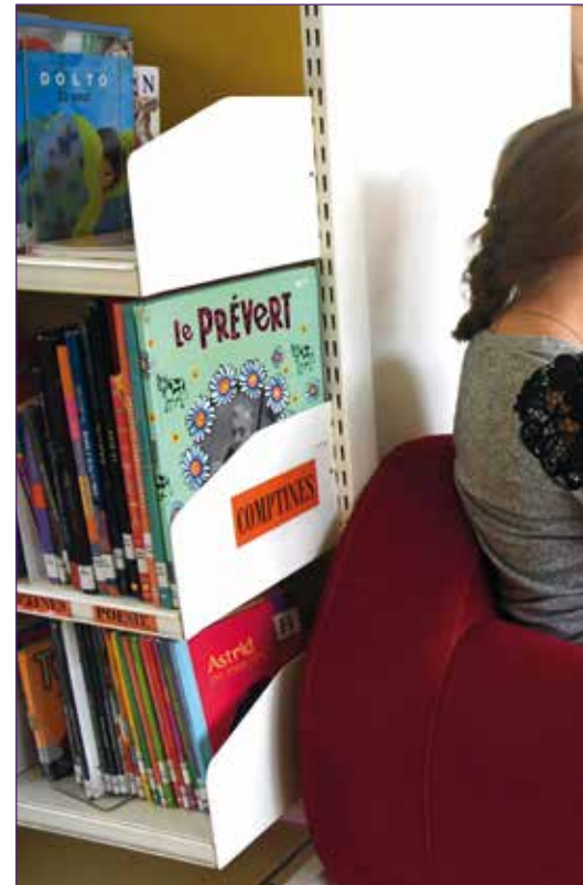
Trois générations de lecteurs

Créée il y a bientôt 40 ans, la bibliothèque a vécu plusieurs vies. Elle s'ouvre plus que jamais aujourd'hui vers l'extérieur.