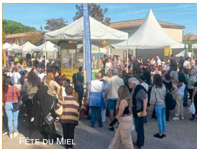
FÊTE DU MIEL