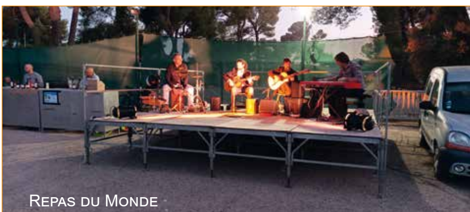
REPAS DU MONDE